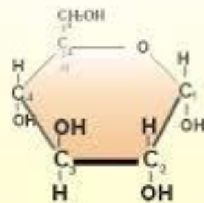
\alpha - D - Glucopiranesa